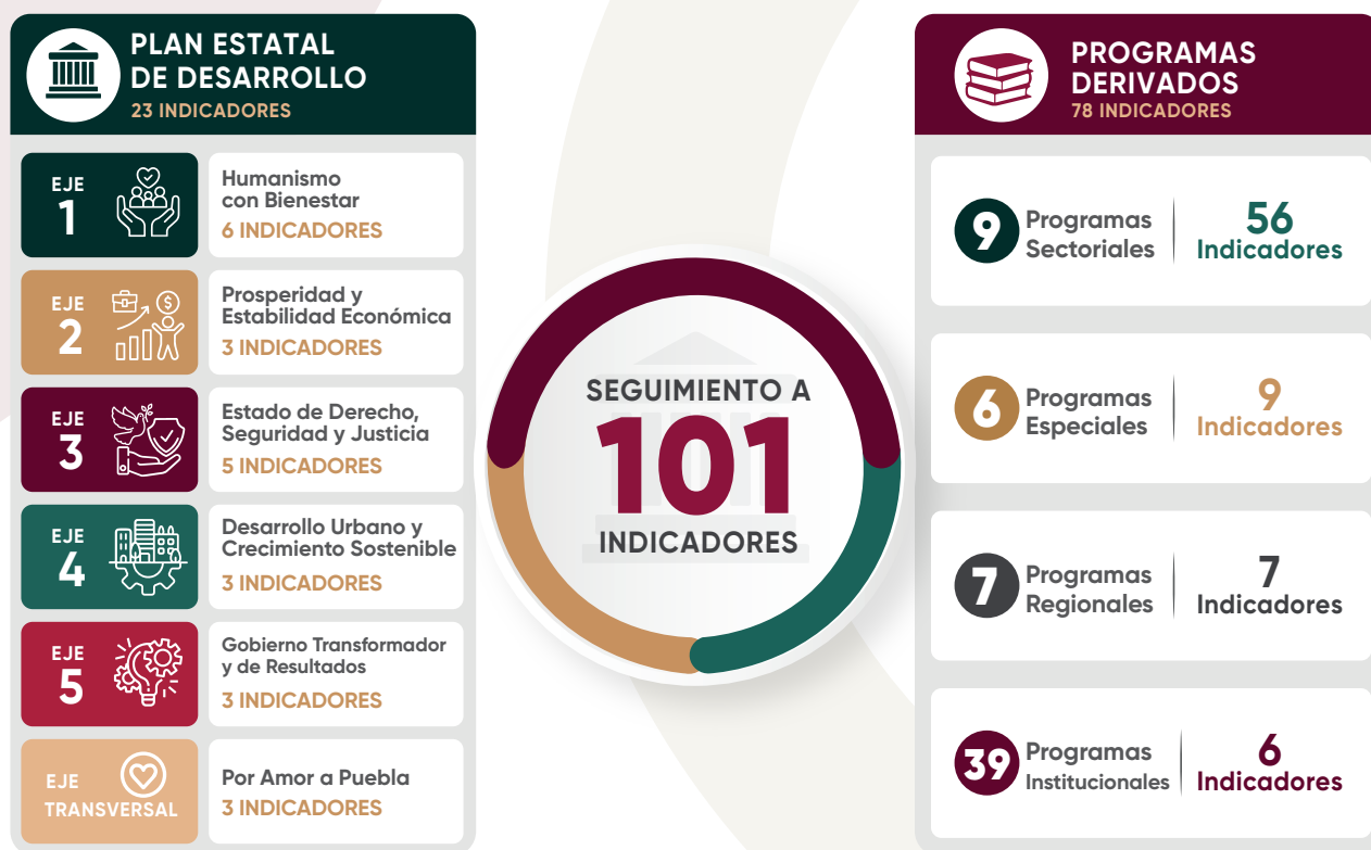
Esquema 1 Indicadores por instrumento de planeación